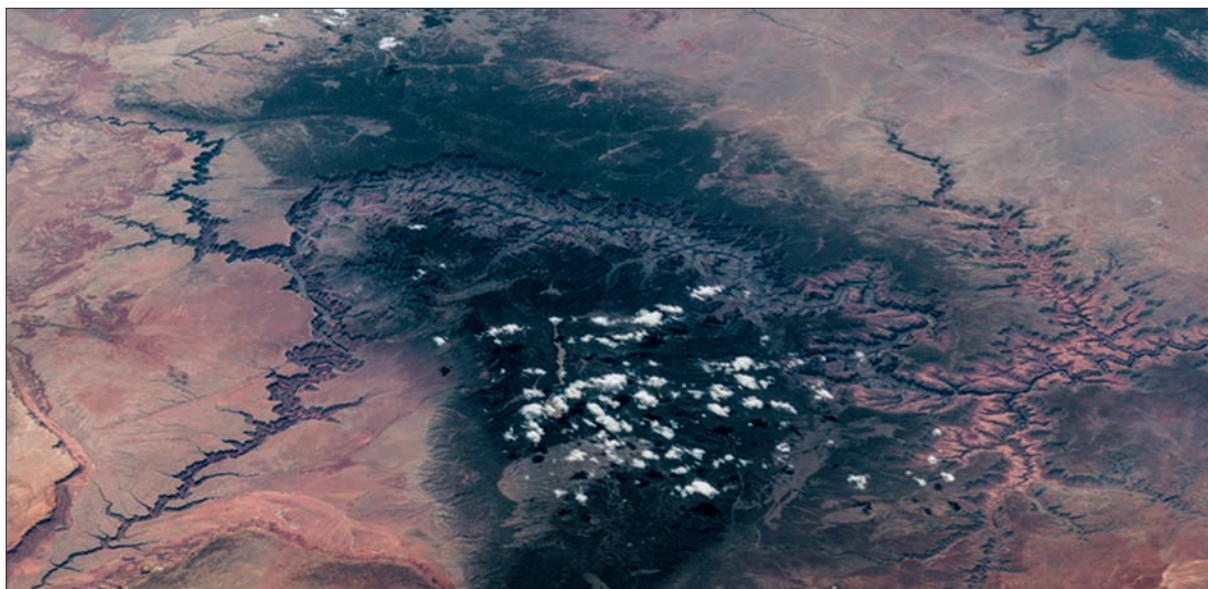
Рис. 1. Линейные цепочки облаков над фрагментами активизированных глубинных разломов в аризонской пустыне, США. Снимок выполнен с борта Международной космической станции в августе 2016 г. с высоты 350 км из итальянского обзорного модуля “Купол”.