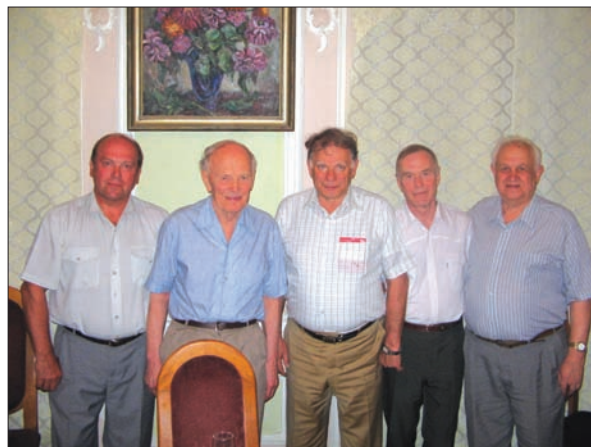
Академіки (зліва направо): А.П. Шпак, Б.Є. Патон, Ж.І. Алфьоров, А.Г. Наумовець, В.Г. Бар'яхтар

Хочу відзначити величезний патріотизм, який проявляли вчені нашої Академії в той час. До нас в оперативну групу безперервним потоком йшли співробітники Академії з проханням дати їм будь-яку роботу з ліквідації наслідків аварії.