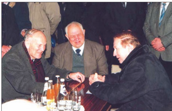
Після Загальних зборів НАН України (зліва направо) Б.Є. Патон, В.Г. Бар'яхтар, Л.Д. Кучма

горовичу, ми Вас підтримаємо, але Вам, у разі успішних виборів, доведеться попрацювати головою Донецького наукового центру. Чи згодні Ви на це?». Звісно, я подякував Борису Євгеновичу за довіру і сказав, що постараюся його не підвести. При цьому я аж ніяк не лукавив. На той час я вже досить добре був обізнаний зі справами в Центрі, і мені дійсно хотілося випробувати себе в ролі його керівника.