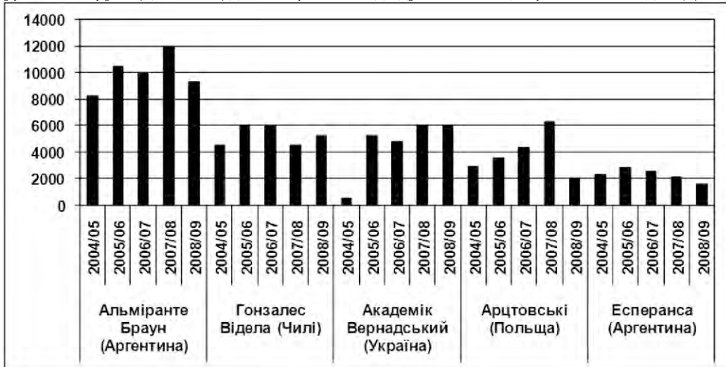
Рис. 2. Кількість туристів на п'яти найбільш відвідуваних антарктичних станціях, 2004–2009 рр. (IAATO, 2009).

Зрозуміло, що така навала туристів вимагає чітких затверджених процедур відвідування станції, спрямованих на унормування (зменшення) загальної кількості візитів. Однак на сьогоднішній день начальники станції й досі керуються напівформальними (усталеними на практиці ще за часів британців) правилами, які загалом зводяться до завчасного попередження туроператором про прибуття судна (за 72 години до запланованого візиту) та розподілу туристів на групи (до 30 осіб) для почергового відвідування станції протягом 2-3 годин. Досі не