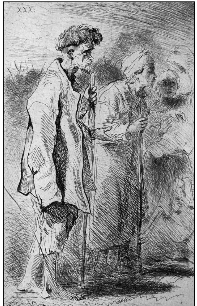
В.Верещагин(1842-1904). Старці-жебраки 1862 р.