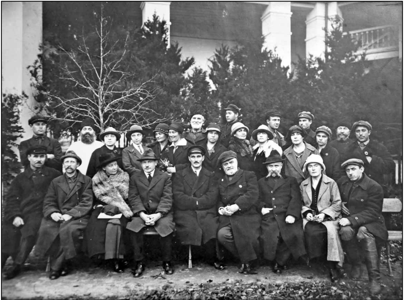
Рис. 3. Корпорація Лаврського музею Культів і Побуту в Києві. 7 листопада 1927 р.