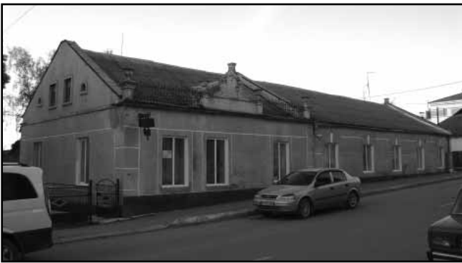
10. Адміністративний будинок (середина XX ст.)

відремонтований (з влаштуванням родинної усипальні) парафіяльний костел св. Михайла. До міста були запрошені переселенці з Галиції, які заснували одне з передмість [5, с. 27], а, найважливіше, – з Німеччини, майстри текстильної справи, завдяки чому Дунаївці за кілька десятиліть перетворилися на розвинутий промисловий осередок. Усе це вимагало безпосередньої присутності власників міста, їх контролю. У 1850 р. садибу було продано Віктору Скибневському. Згідно з малюнком Наполеона Орди, палац був двоповерховий, прямокутний у плані. Дах – чотирихилий. В центрі чолового фасаду будинку розташований вхід з ганком, оздоблений двома колонами. Над ганком, на рівні другого поверху, було влаштовано балкон. Палац був оточений ландшафтним парком, який практично не зберігся. Палац неодноразово перебудовувався: було здійснено прибудови та змінені внутрішні планувальна структура будівлі. В наш час у палаці розташовано міський будинок культури, а на території колишнього ландшафтного парку – міський парк відпочинку.