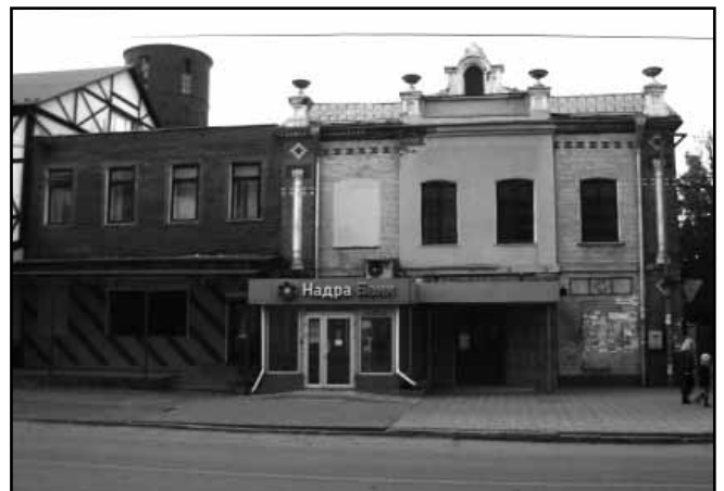
8. Суконна фабрика (друга половина XIX ст.)

купує у попередніх власників – Потоцьких – Дунаєвський ключ і, вірогідно, закладає тут садибу. Джерельна база з цього приводу достатньо обмежена, проте в листуванні Я. Красінського є згадка проте, що частина з них була написана в «резиденції в Дунаївцях» [5, с. 50–54]. Навряд чи цією резиденцією міг бути старий дерев'яний невеличкий замок. Родинним маєтком Красінських була Опіногура, проте і Дунаївцям вони приділяли значну увагу – саме завдяки Красінським нарешті був зведений капуцинський монастир, капітально