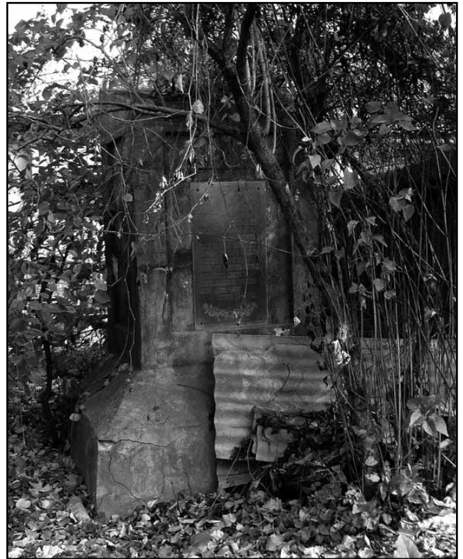
12. Братська могила євреїв, розстріляних фашистами у 1942 р.

Підсумовуючи викладене, можна сказати, що історична спадщина міста, представлена нерухомими об'єктами культурної спадщини, відображає події, пов'язані з державним ладом та суспільним життям, подіями воєнної історії, розвитком культури міста та країни. Проте, лише незначна частина цих об'єктів перебуває на державному обліку та має облікову документацію, що відповідає вимогам чинного законодавства. Значні архітектурні споруди, які не мають статусу пам'яток (мають статус щойно виявлених об'єктів культурної спадщини або пропонуються для взяття на державний облік), представлені стилями класицизму та історизму. Переважно це культові споруди та житлові будинки, розташовані на території міста (більшість – в його центральній частині), а також промислова споруда – будівля суконної фабрики (друга половина XIX ст.) по вул. Шевченка. Серед збережених культових споруд – Вознесенська церква (капуцинський костел) (друга половина XVIII ст.), кірха (1860-ті рр.),