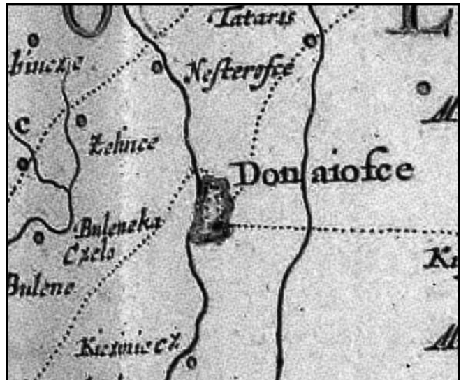
1. Фрагмент карти Г.Д. Боплана Ukrainae pars, quae Podolia palatinatus vulgo dicitur (Частина України, Подільське воєводство) 1655 р.

У XVI ст. поселення ще залишалось неукріпленим, оскільки серед переліку замків Подільського воєводства, який подається в люстрації 1583 р., Дунаївці не значаться [2, с. 260]. Перше (і єдине) відоме картографічне зображення міських та замкових укріплень Дунаївців зафіксовано на карті Боплана 1655 р. [3]. Вони розташовані на лівому березі річки Тернави, у її вигині. Замок показаний незначним, у південно-східній частині міста. При цьому, до нього сходилося кілька шляхів, які проходили через місто. Міські укріплення позначені дуже значними за розмірами: овалоподібної форми, довші сторони овалу розташовані паралельно течії ріки Тернава, проглядаються обриси бастионних