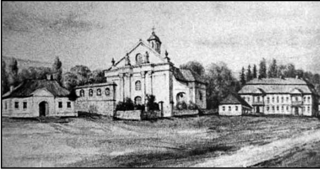
3. Парафіяльний костел в Дунаївцях на малюнку Наполеона Орди (XIX ст.)

досліджень. Принаймні, на більш пізніх картографічних матеріалах XIX ст. замкові та міські укріплення вже не зустрічаються, отже гіпотетично можна припустити, що вони були зруйновані після приєднання Поділля до Російської імперії внаслідок другого поділу Речі Посполитої у 1793 р.