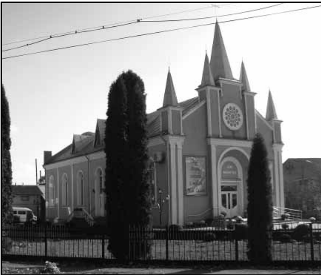
6. Кірха (друга половина XIX ст.)

власника міста В. Скибневського зобов'язали профінансувати перебудову храму з наданням йому рис, притаманних православної церкві [4, с. 6–77]. Зокрема, над основним об'ємом храму було надбудовано глухий купол, у 1889 р. – зведено дзвіницю. В будівлях монастиря була розташована церковна школа. Протягом другої половини XIX – XX ст. храм і споруда монастиря ще неодноразово перебудовувались. Найбільш значна з цих перебудов була здійснена у 1930-ті роки: у 1930 р. церква Вознесіння була ліквідована, будівля храму пристосована під кінотеатр. В ході згаданих вище реконструкцій єдина будівля храму та монастиря була розділена на дві окремі, близько половини споруди монастиря (свого часу у плані являла собою каре) – розібрана. При формуванні пропозицій до внесення зазначених об'єктів до Державного реєстру доцільно подавати даний об'єкт як комплексний «Костел та монастир капучинів» (друга половина XVIII ст.).