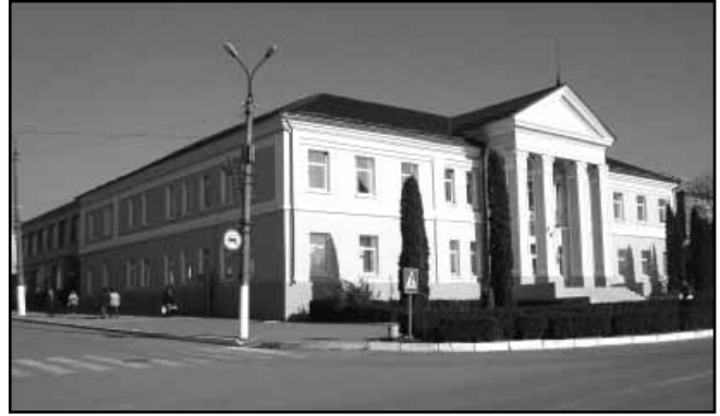
11. Будинок житловий (друга половина XIX ст.)

Місцевому органу культурної спадщини при формуванні пропозицій до Державного реєстру нерухомих пам'яток України варто звернути увагу на те, що, окрім значної архітектурної цінності (незважаючи на перебудови), палац має і історичну цінність, оскільки пов'язаний з ім'ям видатного польського поета-романтика Зигмунта Красінського,