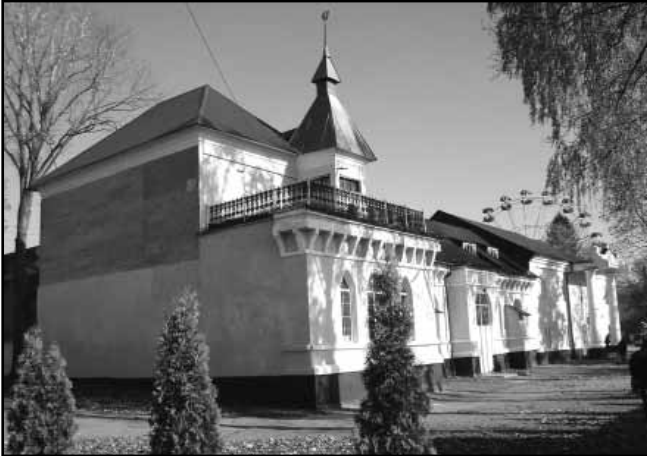
9. Палац Красінських (кінець XVIII – початок XIX ст.)