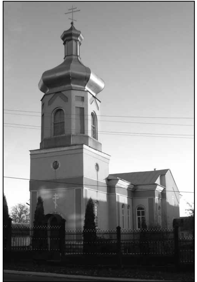
7. Михайлівська церква (1798 р.)