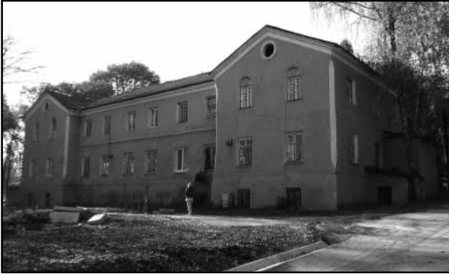
5. Палац Скибневських-Завойко (друга половина XIX ст.)