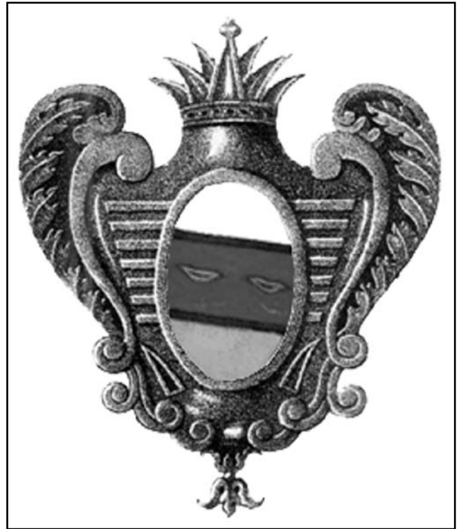
Рис. 1. Герб Путивльського ландміліційного полку. 1730 р.

Тим часом створення полкових прапорів продовжувалось. Герольдмейстерською конторою на чолі з Ф. Санті було розроблено понад 90 емблем