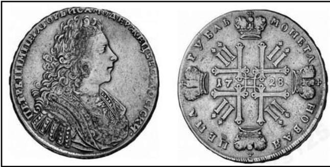
Рубль Петра II