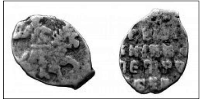
Срібна копійка Петра Олексійовича

Монети колекції опрацьовані науковим співробітником музею О.В. Онопрієнко [9, 96]. Їх подальше вивчення кандидатом історичних наук, доцентом О.А. Бакальцем показало закономірність, що полягає у домінуванні російської монети XVII–XVIII ст., серед якої найбільшу цінність складають срібні та мідні монети номіналом від полтини до рубля, вагою від 20,00 до 25,85 г, з 72 та 77 пробами срібла [5, 107].