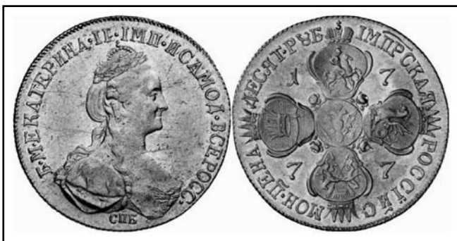
10 рублів Катерини II. Монети зі скарбу с. Пустогород Глухівського р-ну Сумської обл.

Гетьманщини з Московським царством. Срібні копійки належать до часів царювання Михайла Федоровича, Олексія Михайловича, Федора Олексійовича, Петра Олексійовича Романових, талери у переважній більшості відносяться до карбування Голландської республіки (левендалери, на лицевій стороні мають зображення лева), орти карбовано за часів правління польських королів Сигізмунда II, Сигізмунда III, Яна II Казимира. З російських монет найстарішою є копійка Михайла