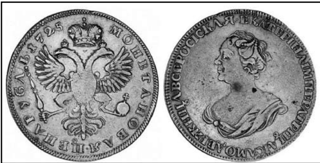
Рубль Катерини I