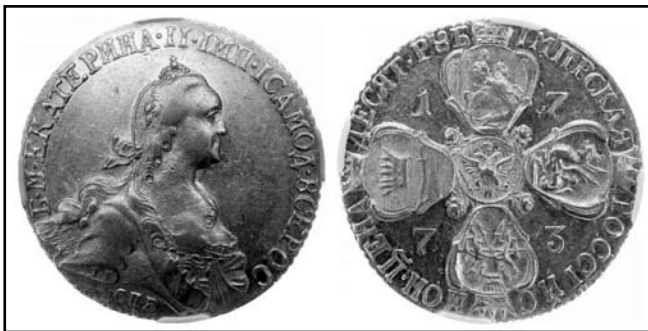
10 рублів Катерини II