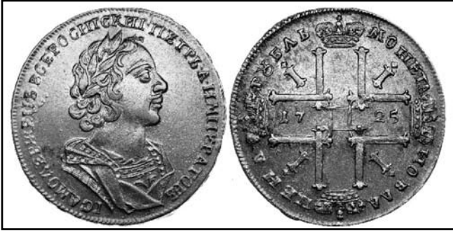
Рубль Петра I