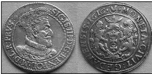
Срібний орт Сигізмунда III

Глинська пустинь. До серпня 1500 р. землі, на яких його було засновано в 1557 р. [6, 73], належали литовському воєводі, князеві Богданові Глинському. Представниця цієї княжої династії Олена Василівна Глинська стала дружиною великого князя Московського Василя III та матір'ю царя Івана IV Грозного. Після смерті чоловіка вона стала регентшею при малолітньому синові, здійснила реформу московської копійки, ввівши до обігу срібний лічильний рубль, який складався зі ста срібних «проволочних» копійок [5, 87]. Пізніше на вилучених у XVII ст. із грошового обігу потертих монетах XVI–XVII ст. – т. з. «чешуйках» – пробивали на кінцях отвори, щоб нанизувати їх на тонкі мотузки. Монети з отворами використовували як нашійні прикраси або як своєрідний скарб, який передавався на користь церкви та монастирів.