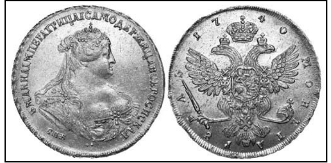
Рубль Анни Іоанівни