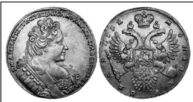
Монети зі скарбу с. Пустогород Глухівського району Сумської області

опрацьований і описаний у монографії О.А. Бакальця «Скарби монет як джерело вивчення грошового обігу Гетьманщини (1648–1781 рр.)» [5, 87–88]. До вивчення Глинського скарбу неодноразово зверталася і молодший науковий співробітник Національного заповідника «Глухів» А.Е. Армен [1; 2; 3]. Він нараховував 294 срібні копійки, 6 свинцевих пломб (підробок) та 16 «мордовок» – грубо скопійованих на Поволжі допетровських монет, написи на яких не читаються. В ньому наявні копійки російських