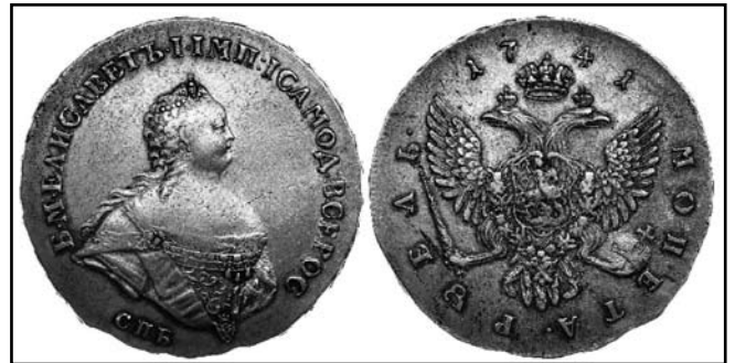
Рубль Єлизавети Петрівни Монети зі скарбу с. Обложки Глухівського району Сумської області