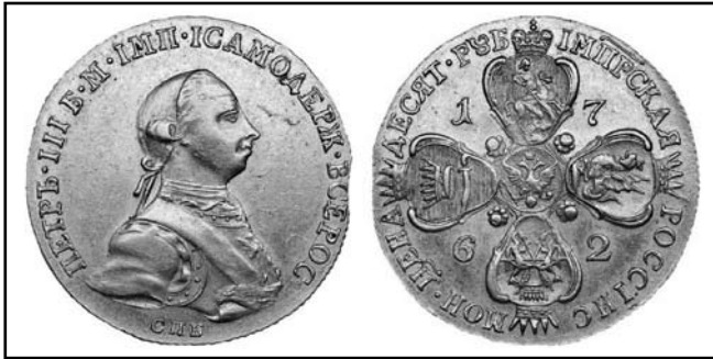
10 рублів Петра III