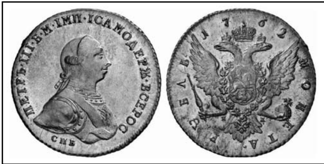
Рубль Петра III