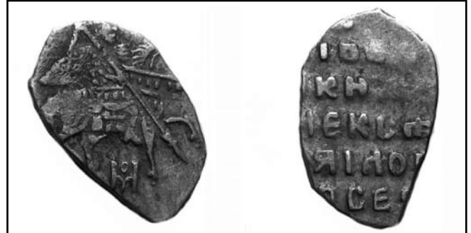
Срібна копійка Олексія Михайловича Монети зі скарбу с. Сопич Глухівського р-ну Сумської обл.

Монетні скарби Глухівщини стали об'єктом дослідження ще в дореволюційний час, коли в 1902 р. у Глухові був відкритий музей українських старожитностей [7, 84]. До 1928 р. його співробітниками було зібрано і виставлено для огляду значну колекцію візантійських, іудейських, давньоруських, російських монет. На превеликий жаль, у зв'язку з подіями Другої світової війни (1939–1945 рр.) та тимчасовим припиненням роботи музею у 1954–1973 рр., ця колекція монет не збереглася. На сьогоднішній день нумізматична колекція Глухівського краєзнавчого музею нараховує близько 1229 одиниць зберігання.