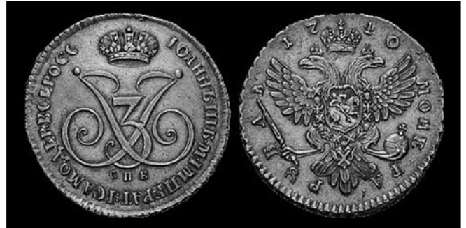
Рубль Іоана Антоновича