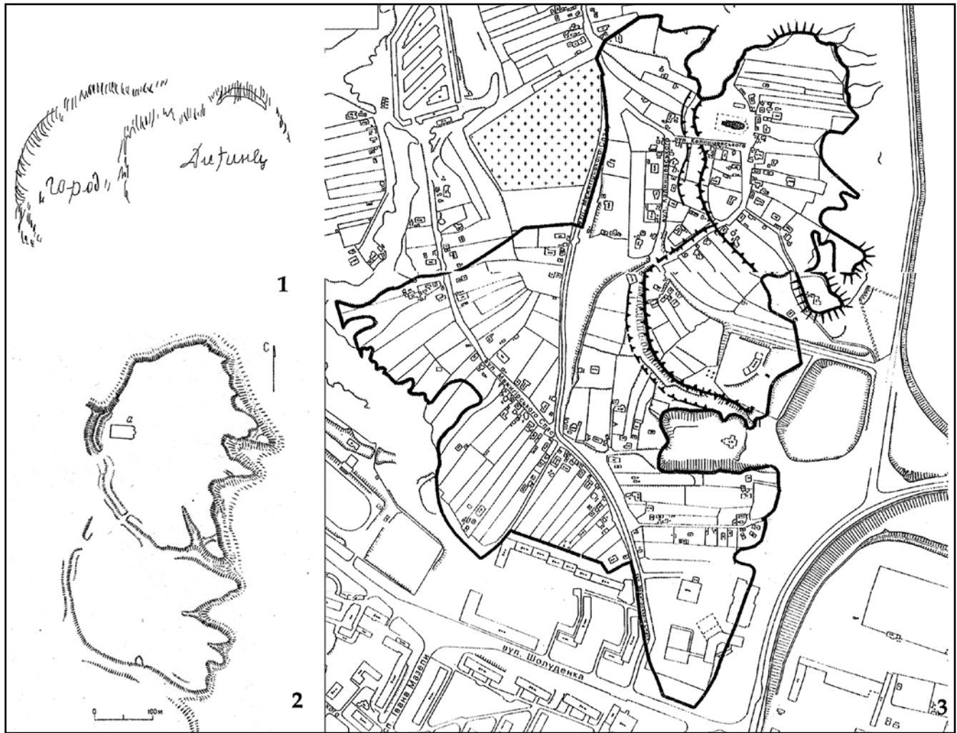
Рис. 2. Плани оборонних споруд Вишгорода: 1) замальовка Т.М. Мовчанівського; 2) план П.О. Рапопорта; 3) сучасна схема Вишгородського історико-культурного заповідника

пам'ятки проведено масштабні розвідувальні роботи, що мали на меті уточнити її планувальну структуру. Наводиться опис укріплень на захід від церкви, згідно якого перепад висот від дна рову до верхівки валу на той час становив близько 10 м, а ширина валу – до 12 м [12, арк. 6]. В'їзд до городища, на думку авторів розкопок, знаходився поруч із «південним виступом західного валу» (на місці сучасного проїзду по вул. Калнишевського) (рис 1, 2) [22, 51]. Спочатку дослідники, як і їх попередники, нерідко приймали за укріплення деталі природного рельєфу. Подається орієнтовна схема укріплень, згідно якої до центральної частини – дитинця – з заходу та південного заходу примикали укріплені «присілки» [12, арк. 5; 14, 1; 15, 11]. Інтерес викликають відомості Ф.А. Козубовського про додаткову лінію укріплень із західного, напільного, боку, на котрі звернув увагу В.К. Козюба [17, 89–90]. Згадується «виразно помітний зовнішній вал із виразним зовнішнім ровом», розташований приблизно в 20-и м на захід від західного («внутрішнього») валу [15, 11]. Утім, на нашу думку, в даному випадку мова скоріш за все йде про природний яр по сучасній