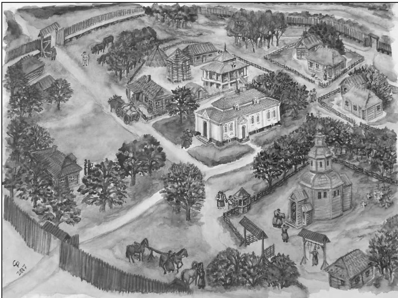
Ситий Ю., Дмитрієнко С. Малюнок-реконструкція «Кочубеївщина, кінець XVII – початок XVIII ст.», 2007 р.