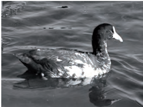
Рис. 3. Лысуха с частично альбиносной окраской оперенья.

Савка – Oxyura leucoccephala (Scop.). С 90-х гг. XX в. савка стала регулярно появляться в Крыму на зимовке и весеннем пролете. Для района исследований была указана в феврале 1855 г. (Carte, 1858). В начале XXI в. встречалась зимой в бухтах Севастопольской (январь 2008 г.: Бескаравайный, 2008) и Круглой (январь-февраль 2013 г.: Андрущенко и др., 2013). Регулярность зимовок этого вида в последние годы подтверждают регистрации двух особей в б.Круглой 09.02.2014 г. и одиночки – с 13.12.2014 г. до 1.02.2015 г.