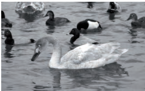
Рис. 2. Молодой малый лебедь.

Малый лебедь – Cygnus bewickii Yarr. В Крыму этот вид стал появляться осенью и зимой в конце XX – начале XXI в. (Белик и др., 2012), на юге (Ялта) впервые зарегистрирован в январе 1999 г. (Мосалов и др., 2002). В Севастополе малый лебедь дважды отмечен в б. Круглая: 28.01.1995 г. (ad) и 01-03.01.2009 г. (sad; рис. 2). Оба раза птицы держались рядом с группами лебедей-шипунцов ( Cygnus olor ), но в отличие от них, не подплывали к берегу ближе чем на 4-5 м.