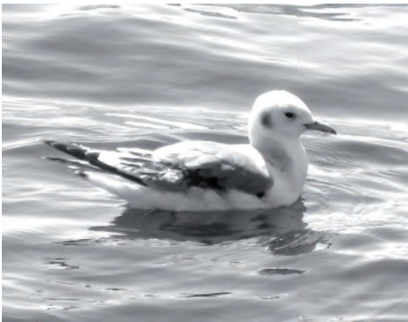
Рис. 5. Молодая моевка.