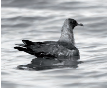
Рис. 4. Средний поморник.