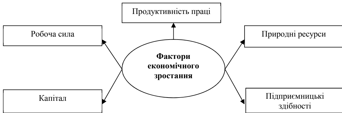
Рис. 1. Основні фактори економічного зростання

Розрізняють два типи економічного зростання: екстенсивний та інтенсивний.