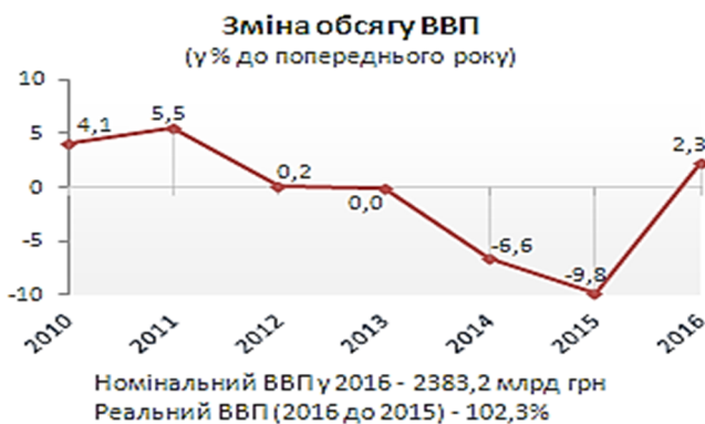
Рис. 3. Зміна обсягу ВВП в Україні за період 2010-2016 рр. [11]

Оскільки ключовим статистичним показником, що відбиває економічне зростання, є річний темп зростання ВВП у відсотках, проілюструємо динаміку даного показника в Україні за період з 2010 по 2016 р. (рис. 3).