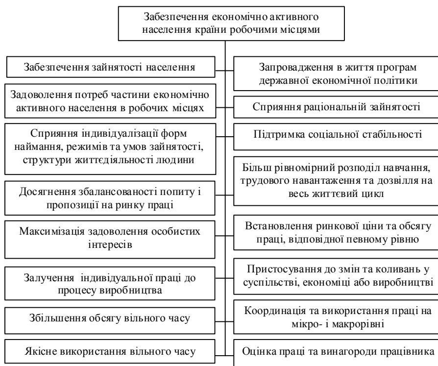
Рис. 4. Завдання логіко-семантичної моделі наочної області зайнятості

неповна, непостійна, вторинна, та неформальна зайнятість; недо(пере)зайнятість; зайнятість у домашньому господарстві та волонтерська діяльність.