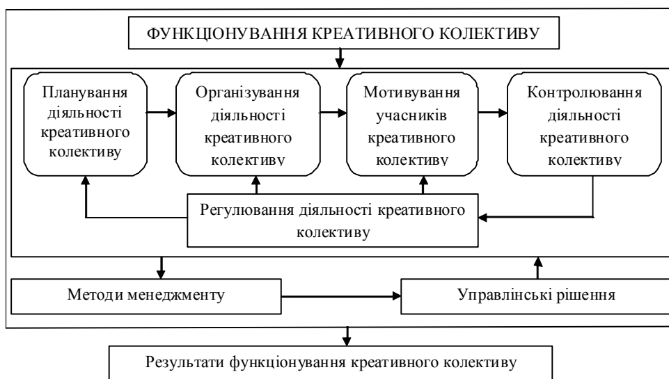
Рис. 2. Напрямки управлінського впливу на функціонування креативного колективу

6) застосування методів менеджменту, тобто спо-