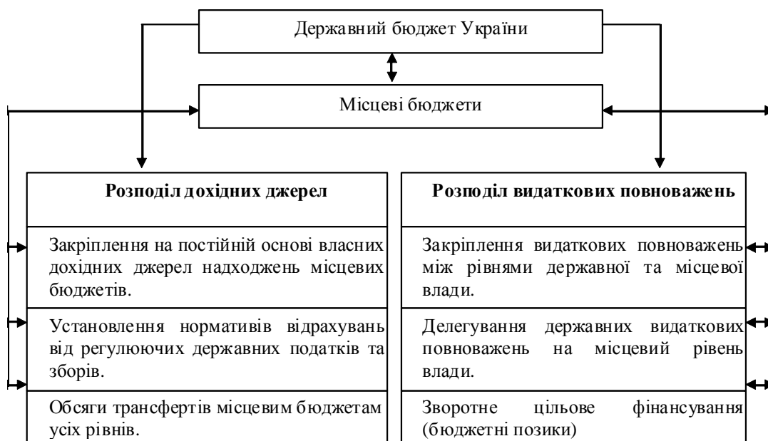
Рис 1. Механізм вертикального бюджетного регулювання в Україні (Складено автором)

Запропонований механізм має теоретичне і практичне значення, дозволяє комплексно підійти до розгляду особливостей організації горизонтального бюджетного вирівнювання на місцевому рівні. З теоретичних позицій запропонований механізм розширює науковий кругозір щодо побудови ефективної системи міжбюджетних стосунків на рівні територіальних утворень. З практичних позицій розроблений механізм дозволяє виділити і структурувати процес обґрунто-