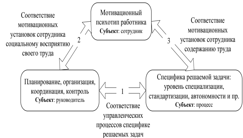
Рис. 3. Базовые условия обеспечения мотивированности сотрудников

Мотивированность персонала, очевидно, не является однородной для всего предприятия. Может оказаться так, что сотрудники одного подразделения обладают высокой мотивацией, другого – низкой. Обусловлено это может быть спецификой решаемых задач, работой кадровой службы, особенностями непосредственного руководителя подразделения и т.д. Поэтому анализ системы мотивации персонала предприятия должен учитывать качество выполнения функций управления в исследуемом подразделении, учитывать специфику задач, решаемых в данном подразделении, а также мотивационный психотип сотрудника, который эти задачи будет решать (рис. 3).