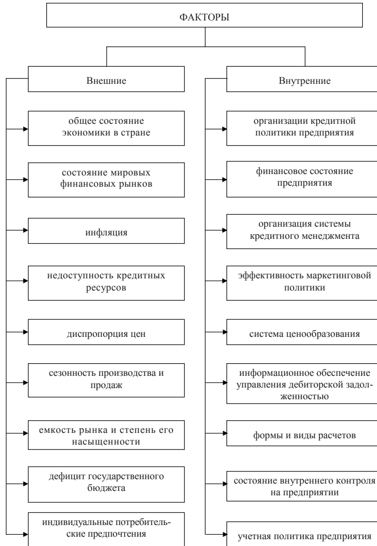
Рис. 1. Факторы, влияющие на уровень дебиторской задолженности предприятий коммунальной теплоэнергетики в условиях финансового кризиса

услуги в условиях финансово- нестабильной экономики притормаживается;