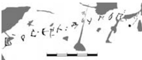
Рис. 4. Графіті №3

не виключена. У праці І. І. Срезневського є зразок вживання подібного обороту: « Потьщитесь вы на середу принести исправлениа ваша » (Поспішіть ви в середу принести виправлення ваші) [5, с. 338]. Палеографічно графіті було визначено в межах другої чверті XI – першої чверті XIII ст., з ймовірним уточненням дати: друга – третя чверті XII ст.