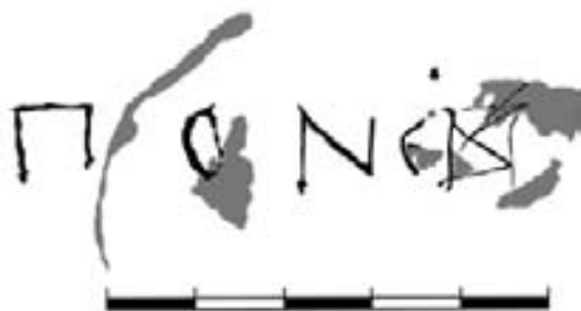
Рис. 5. Графіті №4

Останні два графіті написані на північній стіні. Четверте, по загальній нумерації, є початком недописаної фрази чи самостійним словом (рис. 5). Транскрипція слова може бути така: ПОНЄ(ВА) . Запропоноване тлумачення надпису: « Понєва(?) » (гіпотетично – іменник, можливо, у значенні церковна завіса, плащаниця тощо), в якому остання графема є лігатурою ( ВА ), що не суперечить