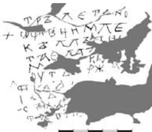
Рис. 2. Графіті №1

стінах апсиди, і їх умовно можна поділити на дві групи: надписи і молитовні зарубки. На південній стіні було знайдено три надписи і три ряди зарубок. На північній є тільки два графіті. Їх збереженість обумовлюється дуже низьким розміщенням від нинішньої підлоги, що, можливо, і зберегло їх від руйнування пізнішими «авторами».