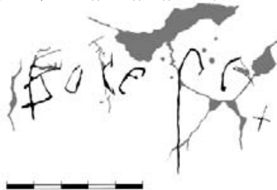
Рис. 6. Графіті №5

Окреме питання – стан самої пам'ятки, збереженої до сьогодні апсиди храму та її фресок. На липень 2016 року в середині апсиди було зафіксоване осипання