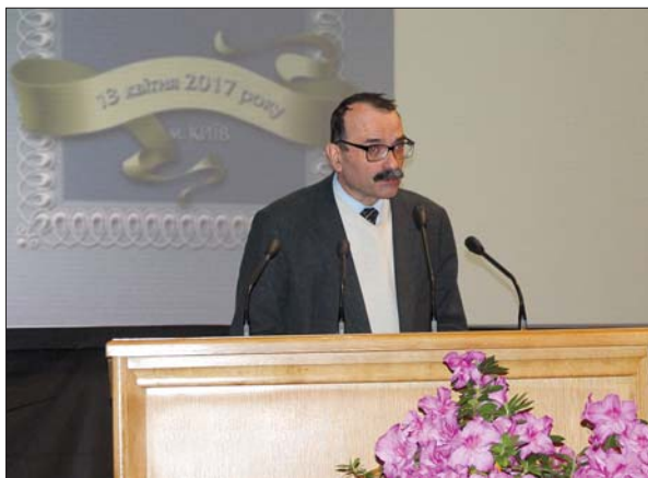
Заступник Міністра освіти і науки України М.В. Стріха

ється постійний діалог, при Кабінеті Міністрів України створено Національний комітет з промислового розвитку, покликаний, серед іншого, налагоджувати зв'язки між наукою та бізнесом (за схемою «від фундаментальної науки через інновації до реального сектору економіки»).