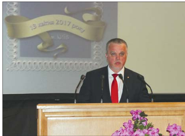
Заступник голови Комітету Верховної Ради України з питань науки та освіти О.О. Скрипник

Зичу всім учасникам сесії плідної роботи, визначення основних напрямів розвитку вітчизняної науки і пріоритетних завдань на майбутнє задля успішного поступу і отримання вагомих результатів, а також щиро бажаю міцного здоров'я, щедрої долі, нових творчих здобутків і звершень в ім'я науки, суспільства та України!