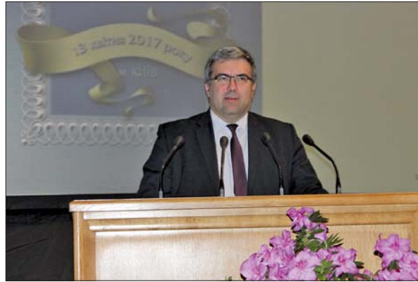
Заступник Глави Адміністрації Президента України Р.М. Павленко

Поза всяким сумнівом, цьогорічне зібрання стане подією, яка сприятиме науково-інноваційному розвитку українського суспільства, згуртуванню зусиль у дослідженні актуальних питань зростання конкурентоспроможності національної економіки, поліпшення якості життя наших громадян, та дієвим поштовхом для нових винаходів та втілення цікавих ідей.