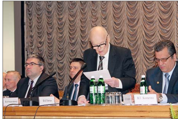
Доповідь президента НАН України академіка Б.Є. Патона

Під час сесії Загальних зборів відбулося також урочисте вручення Золотої медалі НАН України імені В.І. Вернадського. За підсумками конкурсу 2016 року її присуджено академіку НАН України Валерію Володимировичу Скороходу та директору Інституту металургії та