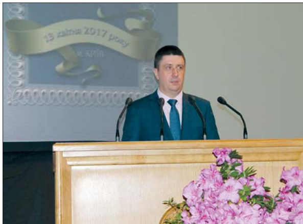
Віце-прем'єр-міністр України В.А. Кириленко