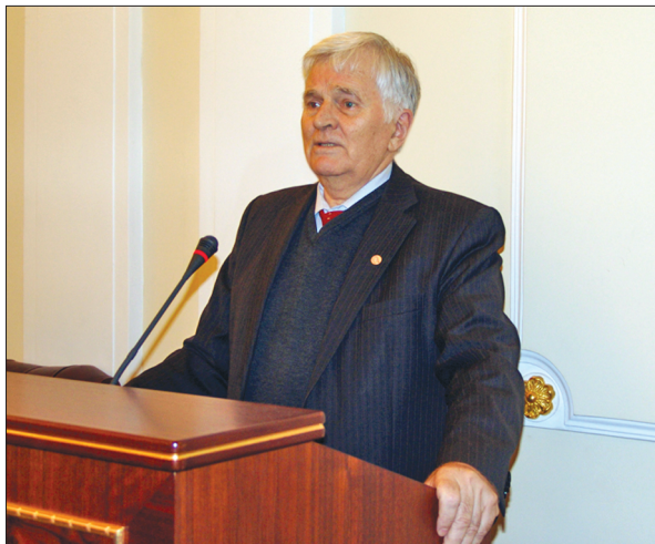
Виступ академіка НАН України Петра Петровича Толочка

ється співіснування пізніх середньопалеолітичних і ранніх верхньопалеолітичних комплексів, тоді як на Північному Кавказі представлений тільки середній палеоліт раннього етапу, а на Середньому Дону й у басейнах Дністра та Пруту існували тільки верхньопалеолітичні комплекси, але впродовж усього перехідного періоду.