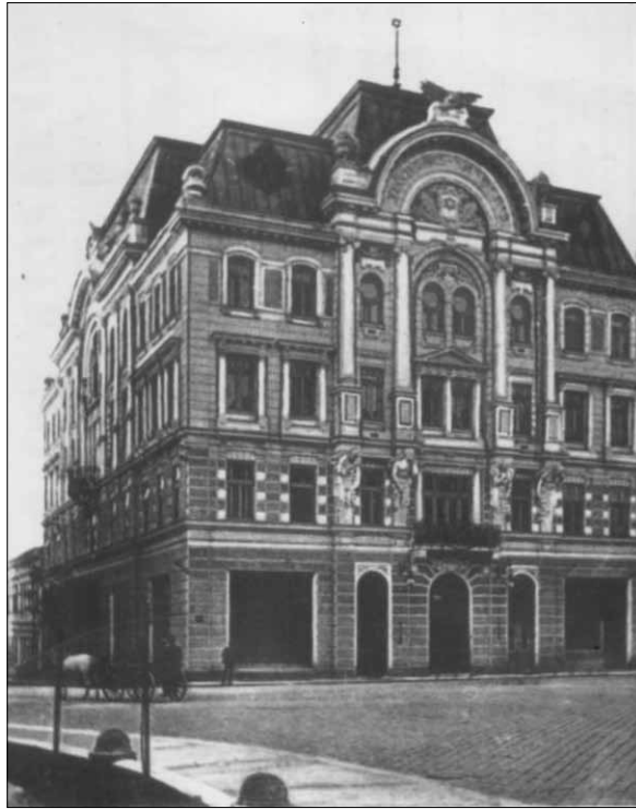
Загальний вигляд будівлі Єврейського народного дому. Репродукція з фото поч. XX ст.