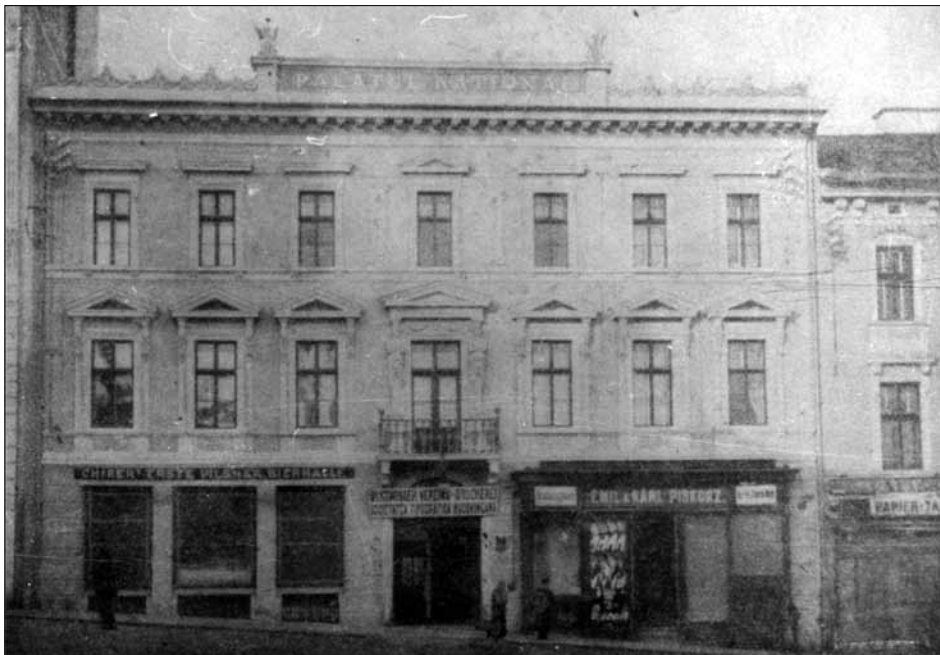
Загальний вигляд будівлі Румунського народного дому (колишній готель «Вайс»). Репродукція з фото поч. ХХ ст. Підстава: 0-38785.

Зображення фасаду Українського народного дому Ілюстрована хроніка товариства «Український Народний Дім» у Чернівцях 1884–1934. – Чернівці: друкарня Т. Іваницький і СП., 1934. – 2 с. Підстава: Науково-довідкова бібліотека Держархіву Чернівецької обл., 37.Б І.43 13509.