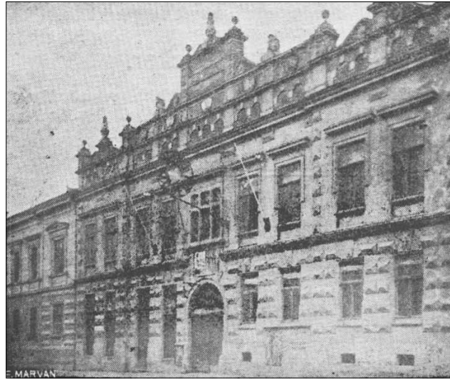
Загальний вигляд будівлі Польського народного дому (Gronich I.

Un album al Cernăuțului. Album von Czernowitz. Cernăuți. – 1925. – pag. 14.