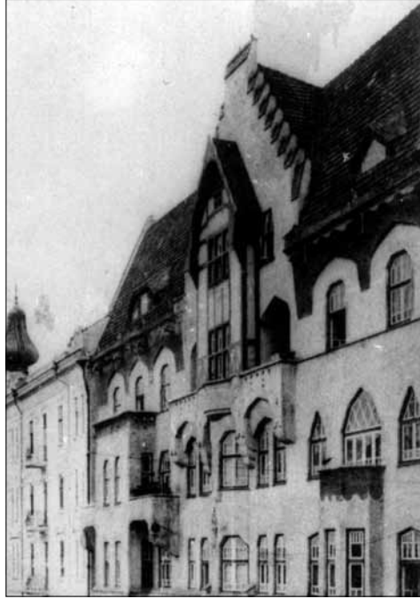
Загальний вигляд будівлі Німецького народного дому. Репродукція з фото 1936 р. Підстава: 0-38842.

з крайовою столицею – містом Чернівці, з крайовим сеймом (фактично з 1861 р.), титулом “герцогства” і провінційним гербом (з 1862 р.) 1 . Повернення до конституційної системи в австрійській монархії і наділення Буковини статусом окремого коронного краю не могли залишитись без наслідків і в площині національної свідомості та культурного розвитку багатонаціонального населення. У цьому періоді (1861–1914) в культурній площині Буковина зазнала найбільшого розвитку. Хоча культурна політика Австро-Угорщини велася під кутом знімечення краю, вона однак послужила важливій меті – національному відродженню. Національне відродження на Буковині розвивалося етапами: від етно-