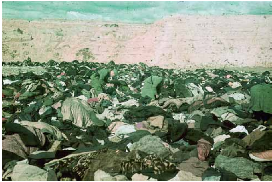
Бабин Яр. Німецькі солдати копаються у речах розстріляних.

ративної групи “С” роти військ СС оберштурмфюрер СС Графхорст; надалі його рота використовувалась для несення охоронної служби в місті, а наприкінці жовтня 1941 р. переведена в дивізію СС “Вікінг” 21 .