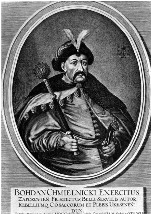
Рис. 5. В. Гондіус. Портрет гетьмана Богдана Хмельницького (1651). НХМУ.

своє значення майже до кінця XVI ст., зокрема і в Україні.