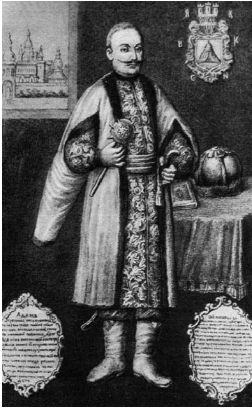
Рис. 6. Портрет київського воеводи Адама Кисіля (копія з портрета 1630-х рр.). Оригінал втрачено.

Статус «українського рицаря» тісно пов'язаний з традиційним комплексом рицарського озброєння. Відтак, булави протягом XV – початку XVI ст. продовжували залишатися у тіні клинкової та інших різновидів древкової зброї. Відомі на сьогоднішній день нечисленні зразки цього періоду – це, насамперед, скромні, суто прагматичні бойові конструкції зі залізними держаками і важкими яблуками переважно округлої форми.