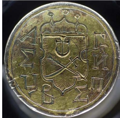
Рис. 12. Торцева частина держака пернача, що належав сумському полковнику А. Г. Кондратьєву. Слобідська Україна, 1687–1688. Військово-історичний музей артилерії, інженерних військ та військ зв'язку (Санкт-Петербург, РФ), інв. № КП 1932, КЕУ 7536, ООФ 129/114.

Син Герасима – Андрій Герасимович Кондратьєв (пом. 1708 р.) був затверджений царським урядом «стольником і полковником» у 1688 р. Набуті посади знайшли своє відображення в абрєвіатурі, вміщеній на перначі. Останній мав символізувати всю повноту військової та адміністративної влади в Сумському полку, що де-факто концентрувалася в руках Андрія Герасимовича [19, с. 222–223].