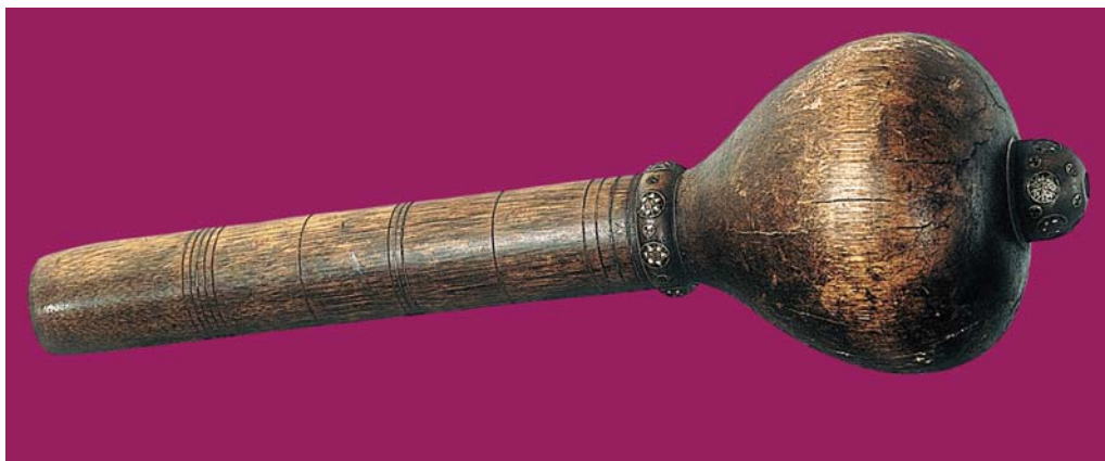
Рис. 4. Булава, Османська імперія, XVII ст. Музей Війська Польського, інв. № 6134 (ш. 21332).

Як бачимо, меч перекрив усі основні соціо-культурні та сакральні ніші, зайняті булавою у попередні часи, та навіть захопив нові, У якості міжнародного символу рицарської звитяги, нерозривно поєднаного з споконвічним поняттям рицарства, саме меч зберігав