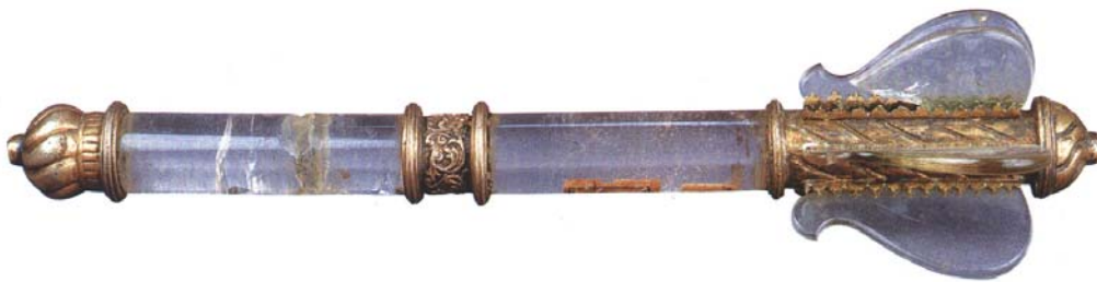
Рис. 13. Пернач, XVIII ст. Колекція Чернігівського історичного музею ім. В. В. Тарновського, інв. № И-4522.

Детальне дослідження козацьких булав, що зберігаються у державних та приватних музеях має стати справою найближчого майбутнього.