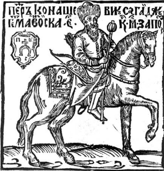
Рис. 3. Петро Конашевич Сагайдачний, гетьман Війська його королівської милості Запорозького. Гравюра з книги К. Саковича «Вірші на жалосний погреб зацного рицера Петра Конашевича Сагайдачного», 1622 р.

хідноєвропейських бойових традицій, засвоєних разом з європейською рицарською мілітарною технологією. Остання зростає на основі воєнної культури вікінгів-норманів до початку XII ст., згодом поширившись на весь Християнський світ. Саме в її руслі формувалася європейський комплекс рицарської холодної зброї.