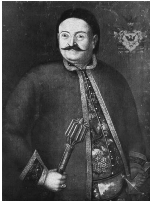
Рис. 9. Портрет переяславського полковника Семена Сулими (1754). НХМУ.