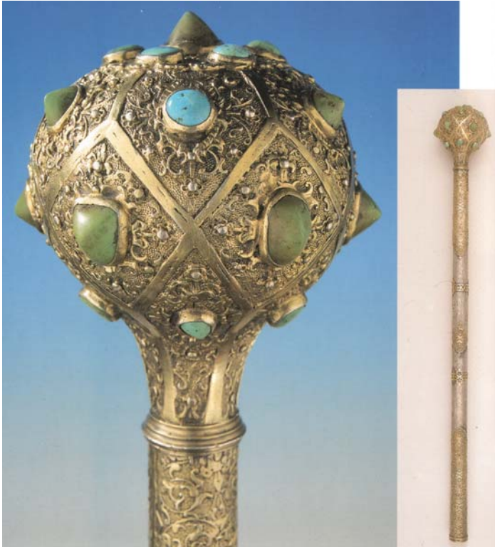
Рис. 7. Булава, XVII ст., Угорщина. Колекція Національного музею Угорщини, інв. № 54.1470.

лося у поверненні в Україну булави як ознаки військової та цивільної влади. Адже в Османській імперії та Персії традиція закріплення за булавою функції уповноваження владної особи протягом Раннього Нового часу набув найвищого розвитку. Так, з булавою, як символом влади козацької старшини, нерозривно пов'язана історія започаткування козацьких клейнодів. Зокрема булава була серед перших клейнодів, переданих козацькому війську польським королем Стефаном Баторієм 1583 р. [12].