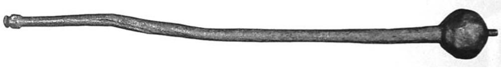
Рис. 1. Булава бойова XVI ст. Черкаський обласний краєзнавчий музей, № ЗС-514. Знайдена в с. Скотареве Черкаської обл. Залізо, лиття, кування. Довжина 475 мм [20, с. 203].

Класична бойова булава з яблуком круглої, грушовидної або призматичної форми на держаку, призначена, насамперед, для розбивання ворожого обладунку. Найдавніші яблука кулястої форми вироблялися з різних сортів каменю, пізніше – бронзи, заліза, навіть дорогоцінних металів.