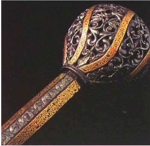
Рис. 10. Булава Пилипа Орлика, XVII–XVIII ст. Кабінет раритетів муніципальної бібліотеки, м. Лінчопін, Лен Естерготланд, Швеція. Загальна довжина 622 мм.

лекції Національного музею Угорщини). Окрім рідкісних морфологічних характеристик, збігаються також хронологічні рамки функціонування булав (Хмельницький та Кемень були сучасниками). Особливо важливим є високе суспільно політичне становище власників булав-близнюків. Обидва зразки наділені високим статусом легітимних атрибутів влади володарів держав. Булави також ілюструють широкі контакти з османським світом обох історичних осіб [16, с. 50].