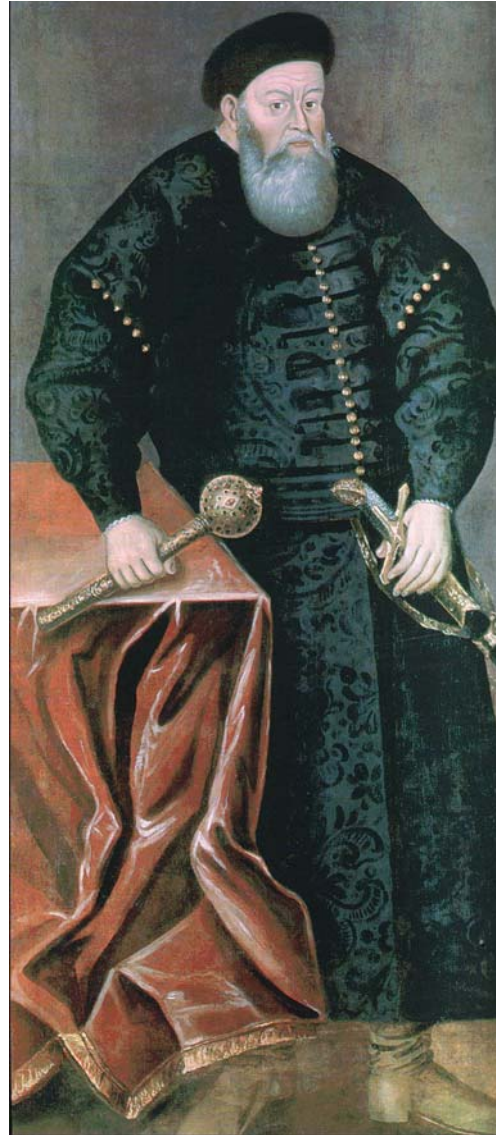
Рис. 2. Портрет великого гетьмана литовського Костянтина Острозького (копія XVIII ст. з портрета пер. пол. XVII ст.). Національний музей історії і культури Республіки Білорусь (м. Мінськ).

Інформацію щодо «плебейської» природи булав та їх застосування можна віднайти також у писемних джерелах, хоча й більш пізнього періоду. Так, Псковський літопис 1502 р., описуючи битву з орденськими рицарями, відзначає, що «...не саблями светлыми секоша их, но биша их москвичи и татарове аки свиней шестоперами...» [2, с. 211].