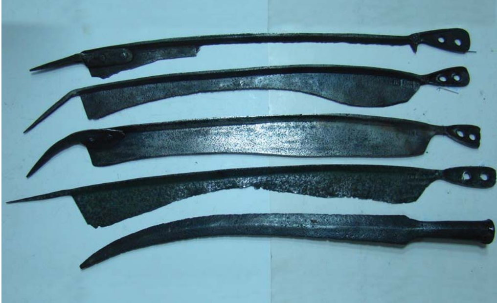
Рис. 4. Бойові коси в колекції Музея історії зброї, м. Запоріжжя.

в верхней части и имеющим черен с двумя сквозными отверстиями и приклепанный граненый шип (Кп 1546, Кп 1436).