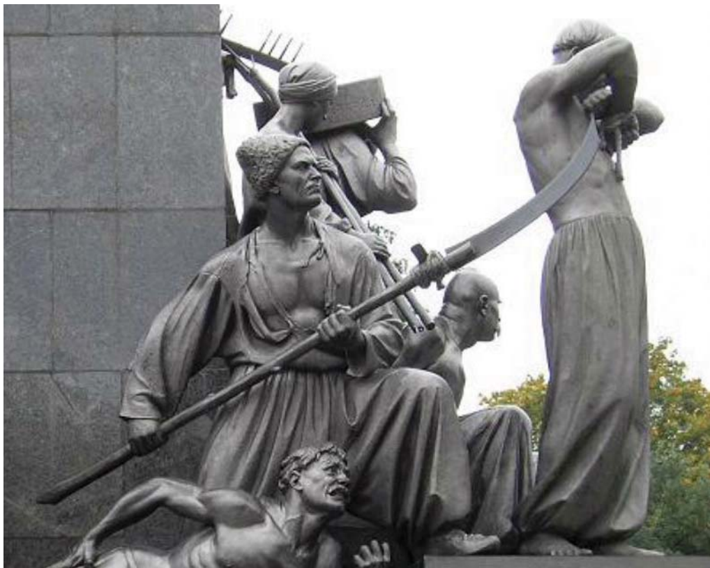
Рис. 1. Фигура гайдамака с боевой косой в скульптурной композиции памятника Т. Г. Шевченку (авторы: М. Г. Манизер и И. Г. Лангбард), г. Харьков.

су, которой отбивал всех, кто хотел его схватить, какой-то солдат напал на него с таким же оружием, но не мог ничего поделывать и, несмотря на свою бойкость, едва избежал, чтобы тот не перерезал его пополам. Тогда какой-то шляхтич ... и какой-то немецкий солдат ... бросились в воду по шею и начали бой, казак, хоть и был пробит четырнадцатью пулями, встретил их еще с большим упорством, что очень удивило польское войско и даже его королевское величество, в присутствии которого заканчивался этот бой. Король очень увлекся храбростью этого человека и приказал крикнуть, что дарует ему жизнь, когда он покажется, на это последний гордо