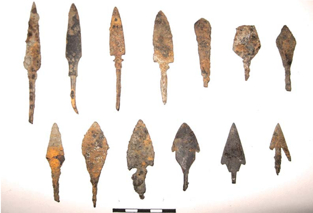
Рис. 2. Наконечники стріл, віднайдені на Чорнівському городищі XIII ст.

ній частині розкопу зафіксовані рештки кам'яного фундаменту від дерев'яної будівлі і розчищена його південно-західна частина. Тоді ж були вивчені три ямних безінвентарних християнських поховання із західною орієнтацією, які перерізали культурні нашарування давньоруського городища. Знайдений матеріал, серед якого і предмети озброєння був датований кінцем XII – першою половиною XIII ст. [23, с. 24-44].