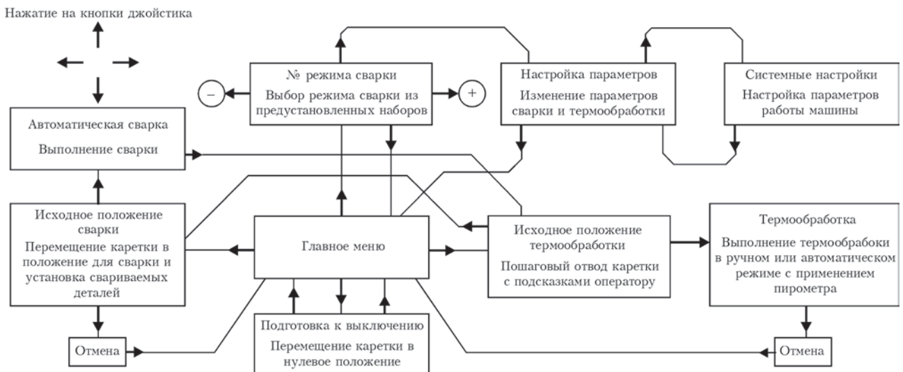
Рис. 3. Блок-схема машины с микроконтроллерной системой управления

Благодаря специально разработанному алгоритму управление сварочной машиной осуществляется одним четырехпозиционным джойстиком, которым выполняется как выбор предварительных настроек сварки, так и запуск самой сварки и термообработки. Упорная рамка, регулирующая свес зуба из зажимов машины и обеспечивающая прямолинейную сварку лент, выполнена общей для двух зажимов, имеет облегченную настройку и допускает поддержку пилы как по зубу, так и по «спине» (рис. 2).