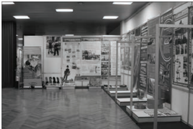
Выставка материалов, оборудования и технологий во время проведения конференции

(металлургия, горнодобывающая промышленность, нефтехимия, транспорт, машиностроение); оборудование для механизированных и автоматизированных процессов наплавки; системы контроля и управления технологическими процессами наплавки; работоспособность; ресурс эксплуатации наплавленных деталей; особенности эксплуатационных разрушений наплавленных деталей; нормативные документы, в том числе международного уровня, для выполнения наплавочных работ.