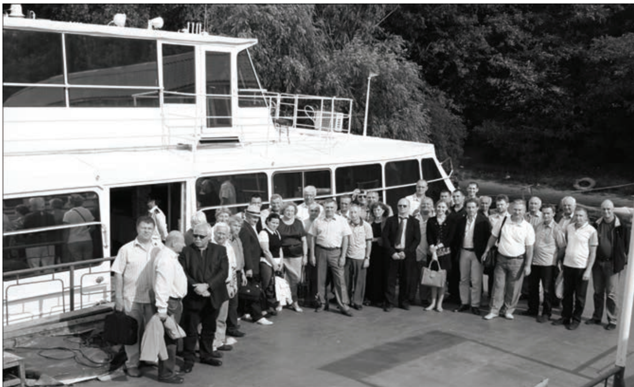
Завершение конференции — прогулка по р. Днепр