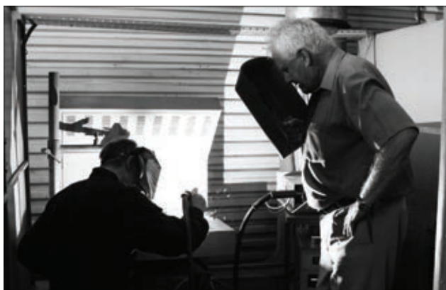
Дуговая наплавка с импульсной подачей проволоки