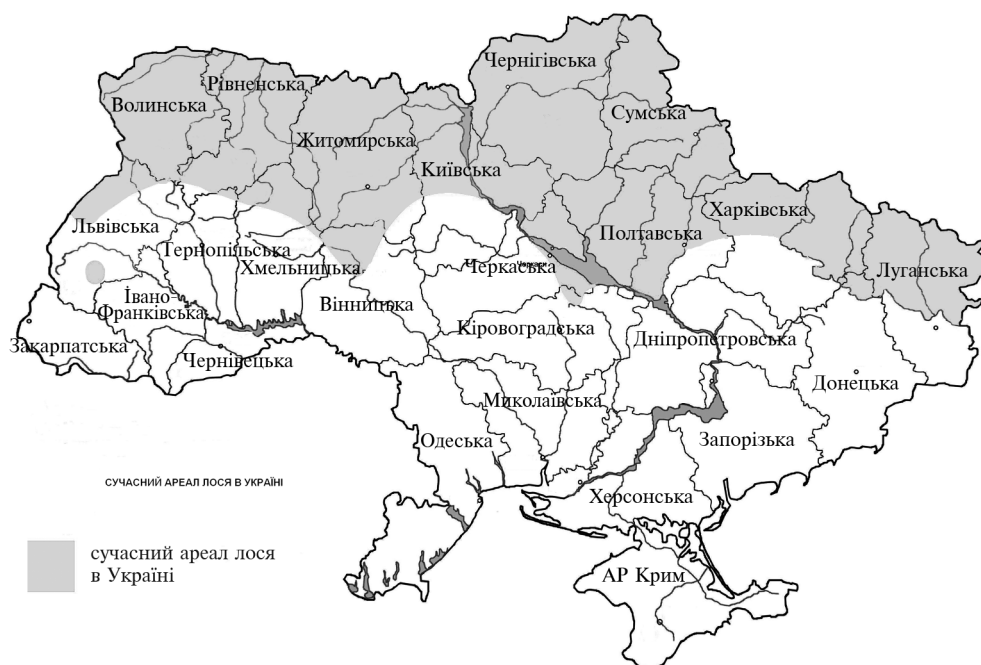
Рис. 2. Поширення лося в Україні станом на 2009 р.