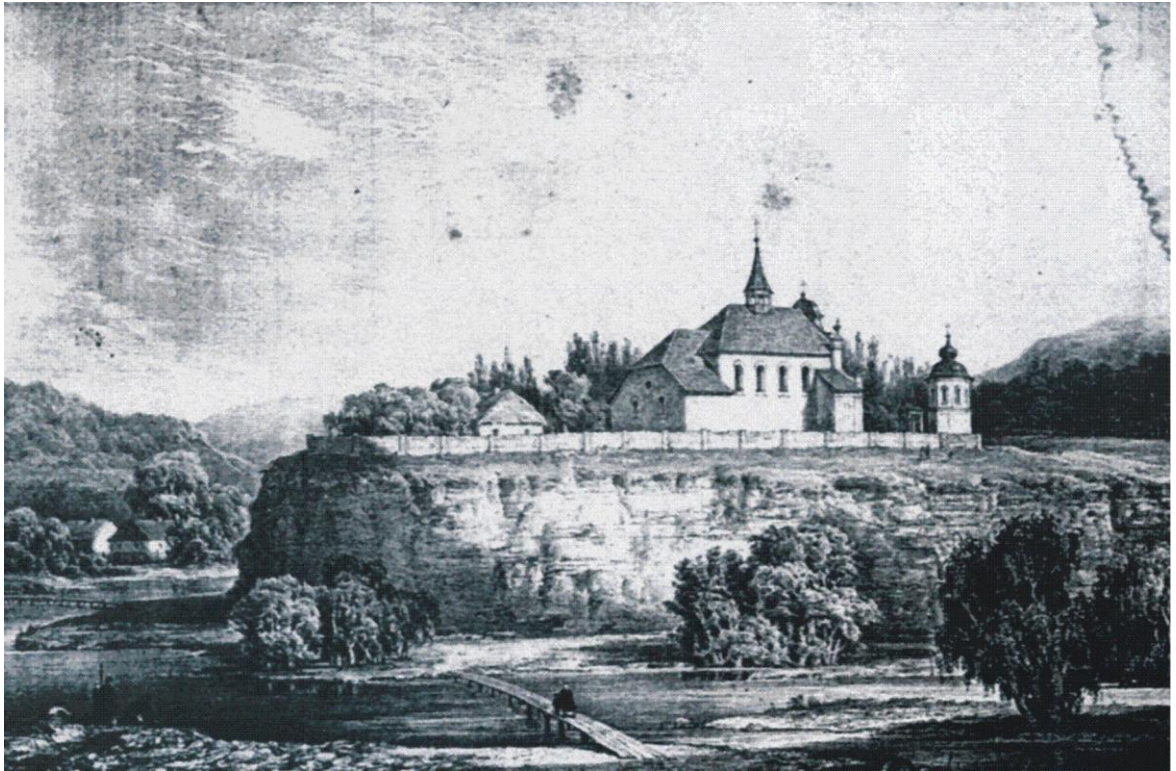
Рисунок 1. Смотрич. До-домініканський костюл при впадінні Яромирки до Смотрича. Рис. Наполеон Орда з фондів Національного історичного музею-заповідника “Кам’янець”.