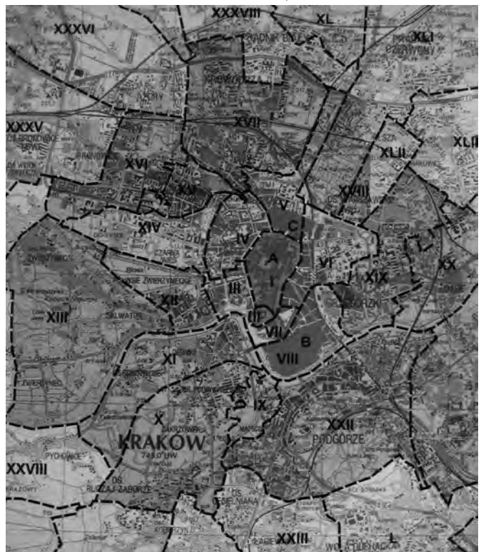
Ілюстр.3 Розвиток міської території Кракова у XIII–XX ст.; фрагмент карти (див.: Kraków // Atlas Historyczny Miast Polskich. – T.5: Matopolska. – Kraków, 2008)