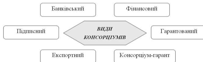
Рис. 2. Види консорціумів.

На практиці переважають консорціуми таких видів (рис. 2):