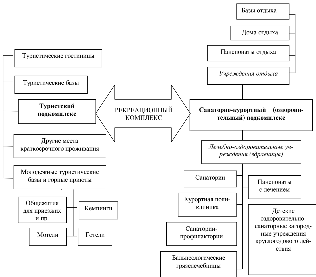
Рис. 2. Структура рекреационного комплекса