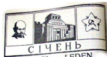
Рис. 7. «Календар Карпатської правди», 1927, рік видання III, стор. 6.