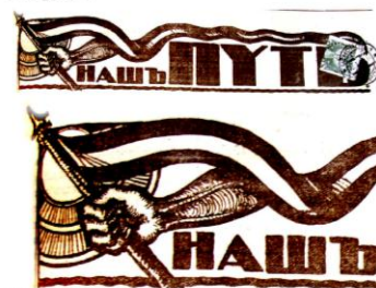
Рис. 11. «Нашь путь», 1937, январь, 23 (10), № 199