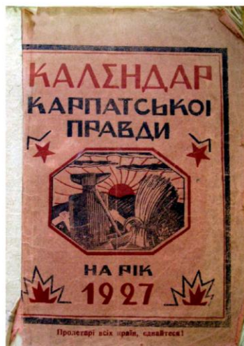
Рис. 6. «Календар Карпатської правди», 1927, рік видання III.

Найчисельнішим зображенням у часописі є карикатура, зокрема, на ілюстрації «Тов. Ленин очищает землю от нечисти» показано Леніна, який стоїть на земній кулі і мітлою проганяє царів та буржуїв. Протиставлення один із засобів карикатури, наприклад «Сон і дійсність», «Буржуазія і її собаки красно їдять, а люде з голоду гинуть» тощо.