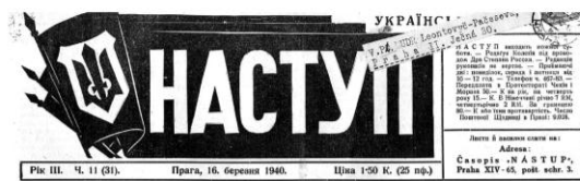
Рис. 5. «Наступ», 1940, рік III, число 11 (31).