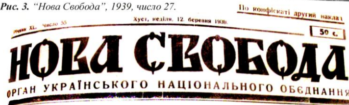
Рис. 4. «Нова Свобода», 1939, річник XL, число 55.