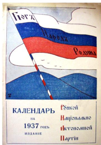
Рис. 1. «Календарь Русской национально автономной партии», 1937.

«Провідники Паризької комуни», «Червона Армія на сторожі Радянського Союзу і світової революції» та ще ряд агітаційних зображень без написів ілюструють «Календар Карпатської правди». Наприклад, вірш В.Сосюри «Про Леніна» проілюстровано портретом Леніна із характерним рухом – витягнута вперед рука. Вождь світового пролетаріату зображений на фоні неба, ніби скеровує Червону Армію у наступ.