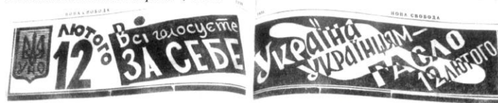
Рис. 3. «Нова Свобода», 1939, число 27.