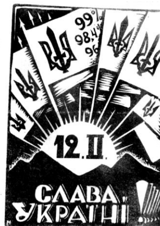
Рис. 2. «Нова Свобода», 1939, число 33.