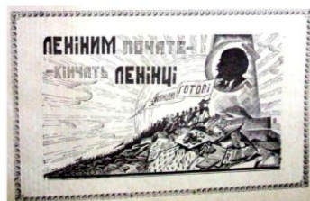
Рис. 9. «Календар Карпатської правди», 1927, рік видання III, стор. 57.