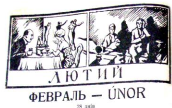
Рис. 8. «Календар Карпатської правди», 1927, рік видання III, стор. 8.