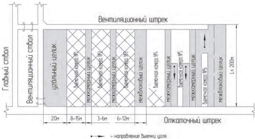
Рис. 2. Ведение горных работ при камерной системе разработки