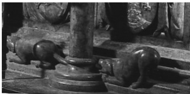
1. Figury psów (pocz. XV w.) – fragment nagrobka Jagiełły w Katedrze na Wawelu