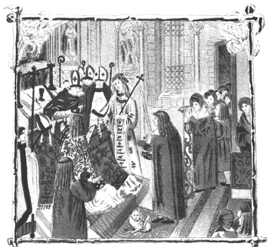
2. Koronacja Aleksandra Jagiellończyka. Miniatura z Pontificala Erazma Cioleka, http://literat.ug.edu.pl/grafika/korona.htm