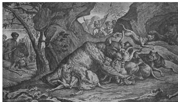
4. Polowanie na niedźwiedzia: rycina, niegdyś w zbiorach Pawlikowskich we Lwowie, http://literat.ug.edu.pl/grafika/misia.htm