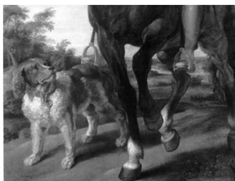
6. Pies Zygmunta Wazy (fragment portreta ok. 1624 P. Rubens)