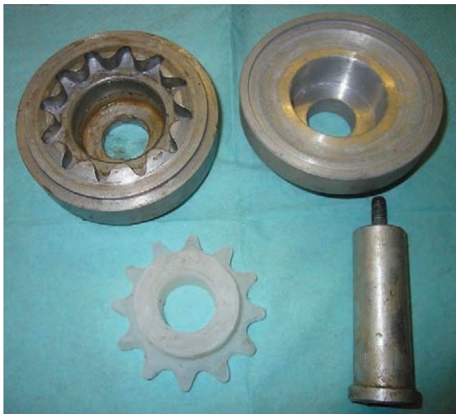
Рис. 2. Оснастка и модель

Варьируя соотношения \frac{\delta_{л}}{\delta_{о}} можно оптимизировать процесс получения ледяной корки на внутренней поверхности пресс-формы. Процесс формирования ледяной модели путем намораживания водной композиции на охлаждаемую поверхность пресс-формы упростит и ускорит процесс производства моделей и соответствующих им отливок. Соотношение (6) дает простую возможность определять температуру охлаждения поверхности пресс-формы для различных материалов пресс-формы и для различных толщин ледяной корки и стенки пресс-формы. Например, при расчете толщины поверхностной корки для получения ледяной модели массой 1 кг в пресс-форме в виде алюминиевого параллелепипеда со сторонами (в м) a = 0,25 ; b = 0,10 ;