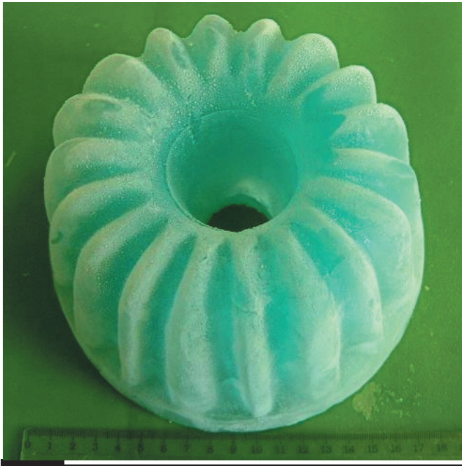
Рис. 1. Модель конической шестерни

Варьируя соотношения \frac{\delta_{л}}{\delta_{о}} можно оптимизировать процесс получения ледяной корки на внутренней поверхности пресс-формы. Процесс формирования ледяной модели путем намораживания водной композиции на охлаждаемую поверхность пресс-формы упростит и ускорит процесс производства моделей и соответствующих им отливок. Соотношение (6) дает простую возможность определять температуру охлаждения поверхности пресс-формы для различных материалов пресс-формы и для различных толщин ледяной корки и стенки пресс-формы. Например, при расчете толщины поверхностной корки для получения ледяной модели массой 1 кг в пресс-форме в виде алюминиевого параллелепипеда со сторонами (в м) a = 0,25 ; b = 0,10 ;