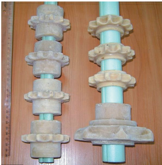
Рис. 4. Модельные блоки

стержень и заполняют ее водной композицией с температурой около 0 °С. Композиция замерзает путем теплопередачи от охлажденного песчаного стержня. При этом вначале происходит фазовый переход воды в лед с выделением тепла