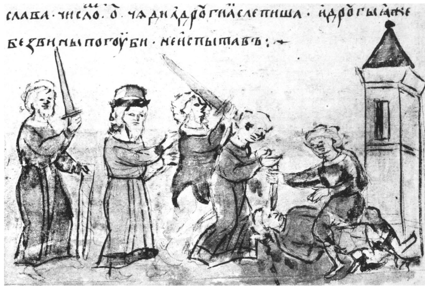
Мал. 1. Розправа з повсталими киянами в 1069 р.

льпленъ» 8 , — так відповіли Мономах та Ольговичі на спробу Святополка перекласти всю провину на Давида), а принаймні двоє з трьох осліплювачів були людьми Святополка, — це конюший Сновид Ізечевич та «овчюх» торк Берендей. На цьому ж наполягав і сам Василько в промові до Володаря під Бужськом: «я се створилъ ци ли оу моємъ городъ азъ и самъ боялєся аще быша и мене не яли и створили то же неволя ми было пристати свѣту ихъ ходящу в рукахъ ихъ» 9 . Давид тут змальовує себе звичайним пішаком у грі сильніших князів, — а саме Святополка.