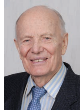
Академик Б. Е. Патон

Дальнейшим этапом развития лучевой технологии явилось ее применение для целей сварки и резки лазером. Проводятся систематические исследования в области импульсной и непрерывной лазерной сварки. В последнее время специалистами институ-