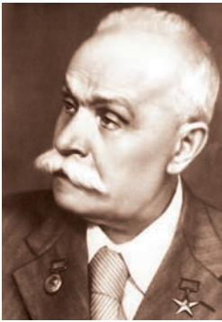
Академик Е. О. Патон

Институт электросварки создан академиком Евгением Оскаровичем Патоном в составе Всеукраинской Академии наук в 1934 г. на базе электросварочной лаборатории при Кафедре инженерных сооружений ВУАН и электросварочного комитета. Становление и вся последующая деятельность Института электросварки (ИЭС) связаны с именем этого выдающегося инженера и ученого. Он определил основные научные направления института в области технологии сварки и сварных конструкций, которые актуальны и сегодня.