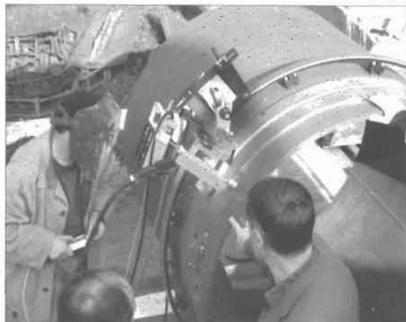
Автоматическая сварка неповоротных стыков — система Orbital Railtrac