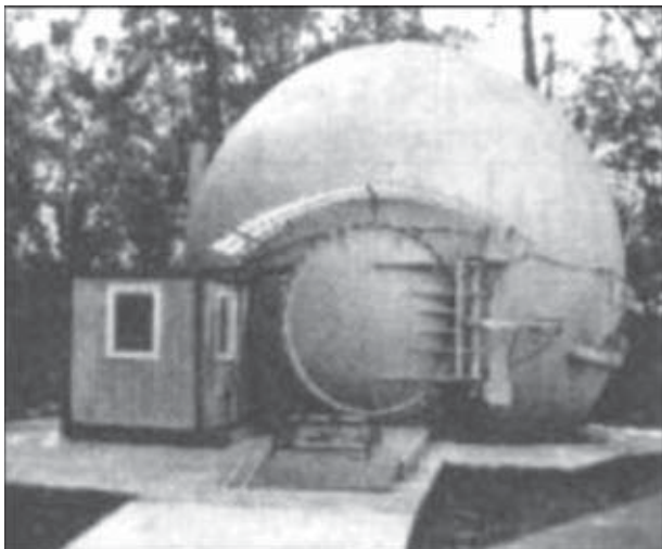
Рис. 2. Полуавтоматическая взрывная камера ВК-10

Мощной сферической ВК является уникальная камера 13ЯЗ, установленная на специальном фундаменте