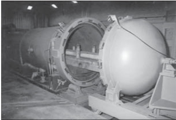
Рис. 1. Взрывная камера КВГ-16 с выдвинутым рабочим столом

внутреннюю (силовую), воспринимающую при взрыве основную нагрузку, и внешнюю (герметизирующую). В камере имеется предметный стол (опора), выполненный из металлических листов с резиновыми прокладками, существенным недостатком которого является малая долговечность верхнего листа, выдерживающего ограниченное количество подрывов. Для загрузки камеры используется специальный манипулятор, вталкивающий изделие с зарядом в взрывную камеру. Внешняя крышка открывается гидроцилиндром, а внутренняя открывается и закрывается штоком манипулятора. В конструкции предусмотрен аварийный люк. Подобные камеры эксплуатируются на Новосибирском стрелочном заводе.