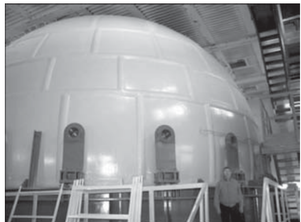
Рис. 3. Уникальная сферическая ВК 13ЯЗ РАН ЦКПВ

В 1970-х годах в ИЭС им. Е. О. Патона разработана принципиально новая конструкция мощной ВК, рассчитанная на заряды до 200 кг ВВ. Корпус ВК выполнен из отрезков заглушенных