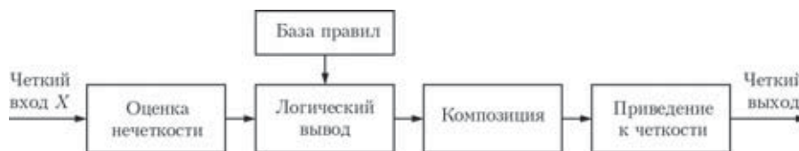
Рис.1. Система нечеткого логического вывода