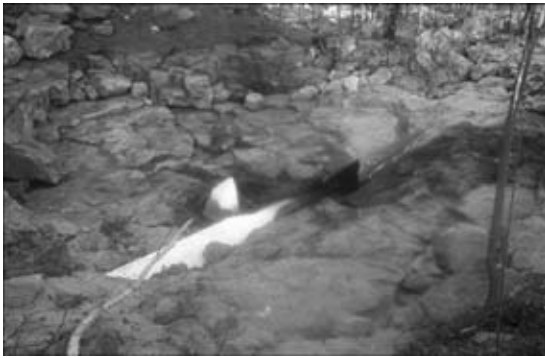
Рис. 2. Общий вид разрушения магистрального газопровода Бэргэ–Якутск

ного кольцевого шва (рис. 2). После аварии были собраны фрагменты разрушения общей протяженностью 2160 мм. Кольцевой шов разорван поперец на четыре отдельных участка: 1010, 235, 315, 127 мм соответственно. Общая длина шва по периметру составляет 1687 мм. Разрушение носило взрывной характер без возгорания. Распространение трещин происходило по механизму отрыва на местах остановки трещины, переходящим в механизм сдвига с пластическими составляющими.