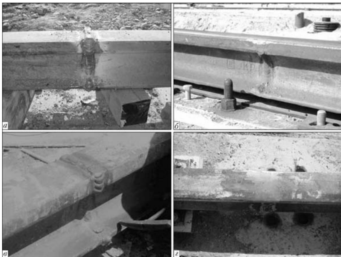
Рис. 4. Крановые рельсы КР100 (а, б) и КР120 (в, г) после сварки (а, в) и шлифовки (б, г)