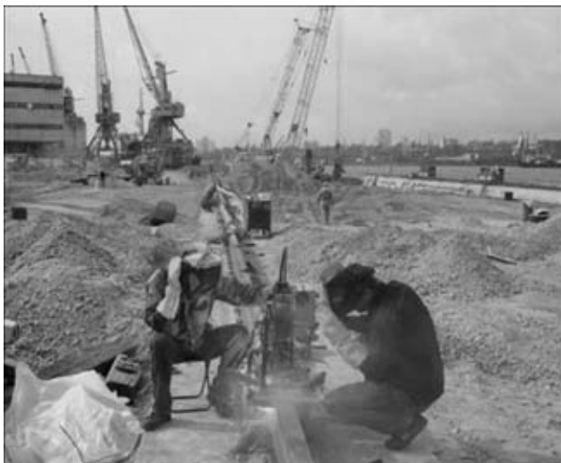
Рис. 3. Сварка подкрановых путей

Он отличается портативностью и благодаря сменной формирующей оснастке легко перенастраивается на сварку рельсов различных типоразмеров. В качестве сварочного источника используется инвертор ФОРСАЖ-500 Рязанского государственного приборного завода. Питание может осуществляться как от трехфазной сети напряжением 380 В, так и от автономного электрогенератора мощностью 25...30 кВт·А, при этом потребляемая при сварке мощность составляет до