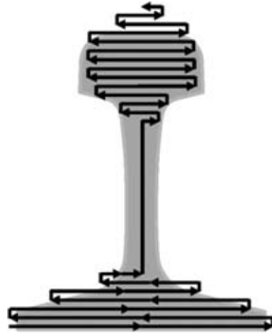
Рис. 2. Схема перемещения мундштука при электродуговой сварке рельсов ванным способом с использованием плавящегося мундштука

15 кВт·А. Среднее машинное время сварки стыка рельсов типа Р65 составляет около 20 мин, что сводной бригаде из пяти человек (два оператора-сварщика и три рабочих-путейца) позволяет достигнуть производительности до 16 стыков за смену.