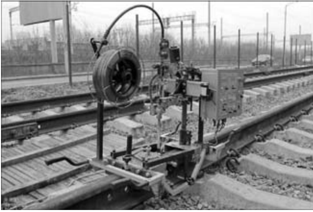
Рис. 1. Аппарат APC-4 для сварки рельсов

гистральных железных дорогах. Разработано специализированное оборудование — аппарат APC-4 (рис. 1).