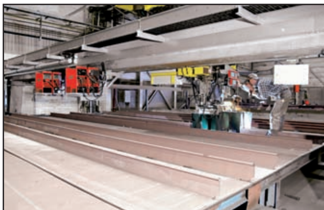
Рис. 2. Автоматизированная система для тандем сварки TimeTwin на предприятии Pus-Werften, Германия

Fronius TimeTwin — это высокопроизводительный способ тандем сварки двумя плавящимися параллельно расположенными электродами в защитном газе. Две сварочные дуги позволяют значительно увеличить, по сравнению со стандартным процессом MIG/MAG, скорость сварки (до 6 м/мин) при максимально возможном качестве сварного шва и производительности. Автоматизированные системы для сварки TimeTwin применяются для выполнения одно- и многопроходных (толщина до 70 мм) швов при изготовлении корпусов алюминиевых танкеров, панельных линий, а также для ряда специальных задач, где предъявляются высочайшие требования относительно контроля тепловложения и механико-технологических характеристик соединения.