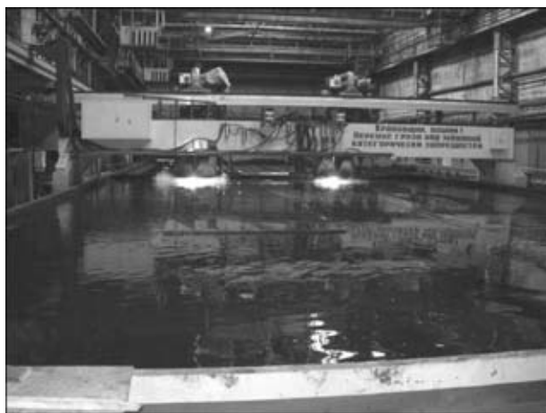
Рис. 1. Установка «Telereх TXB-10200» в работе

Корпуса современных судов состоят из листового и профильного проката, отличающегося между собой размерами, формой и материалами. Листовые детали составляют 85...90 % массы корпуса судна. Количество деталей для постройки одного судна может достигать нескольких десятков тысяч. Основным способом их изготовления является термическая резка, на долю которой приходится около 80 % общего объема выполняемой резки, а трудоемкость составляет 30 % трудоемкости всего объема работ корпусообработывающего цеха.