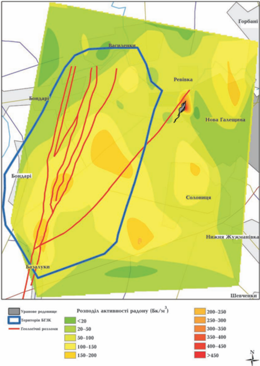
Рис. 2. Активність еманції радону з ґрунту на території Біланівського ГЗК.

розмірами, формами прояву на земній поверхні структурно-геологічні об'єкти, що мають центральну симетрію у перетині із землею поверхнею (серед них розрізняють достовірні й передбачувані).