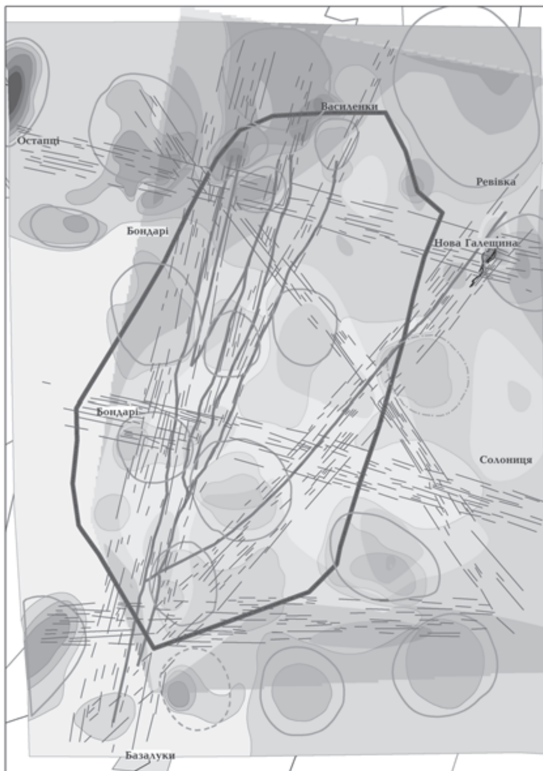
Рис. 3. Активні на четвертинному етапі розвитку розломні структури, асоційовані з зонами підвищеної активності радону.

досліджень (моніторингу). Хоча саме Кременчуцьке родовище знаходиться за межами ліцензійної ділянки Біланівського ГЗК, необхідно враховувати можливий потенційний вплив